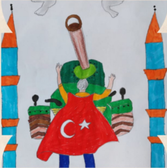
MERT AHMET USLU 4/E