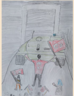
ŞENOL KERİM ERSE 4/E